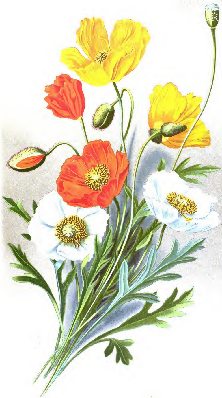
Papaver nudicaule L.

Маки Сибирскіи [голостебельный] въ разноцвѣтныхъ сортахъ.